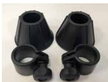
Coppia di coni e anelli da tenuta