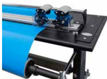
Sistema di taglio (RH / Easy cut 165)